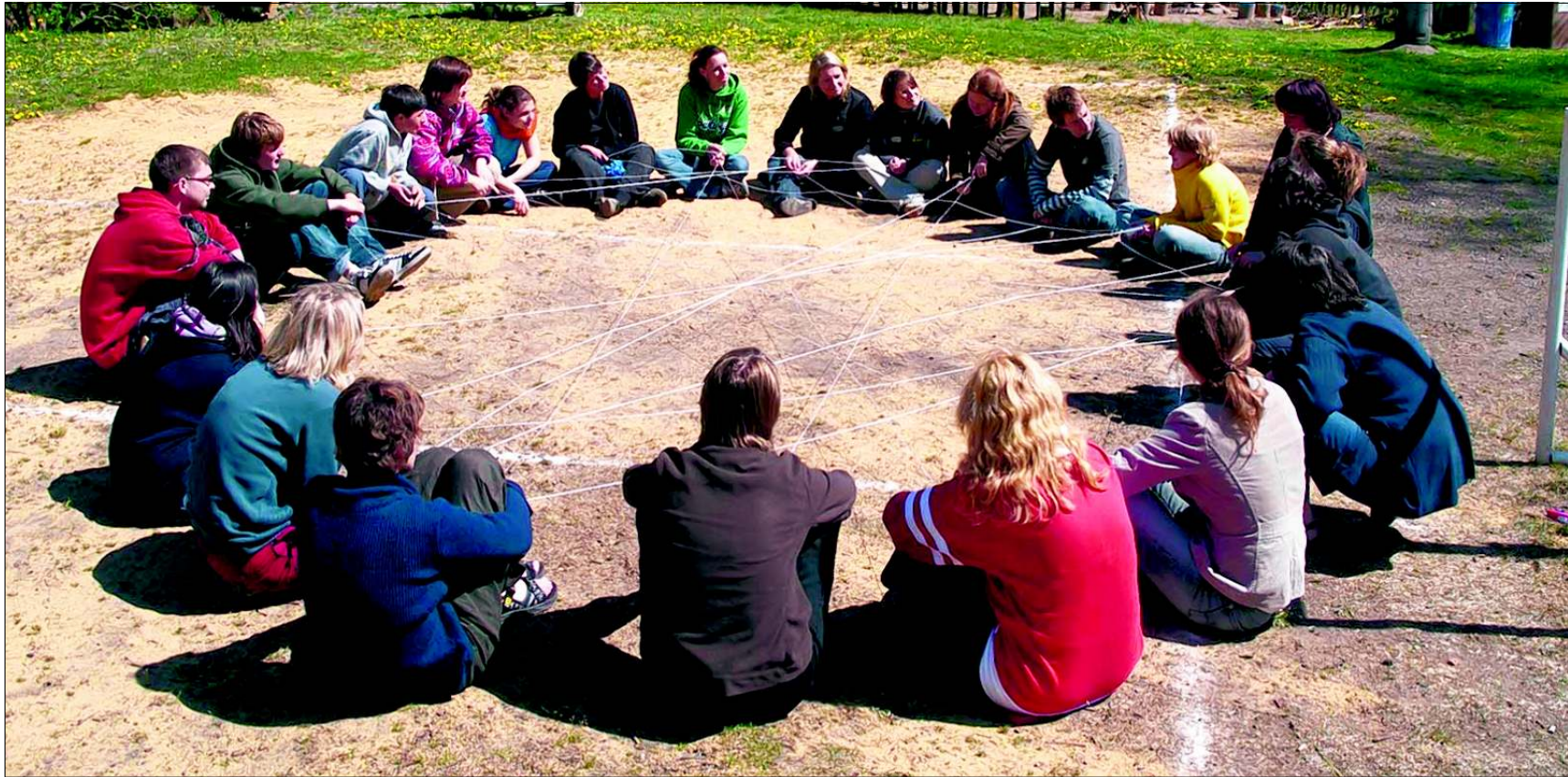
Kontakte knüpfen und Vorurteile den Nachbarn gegenüber abbauen: Dazu sollen die Angebote von Tandem beitragen.