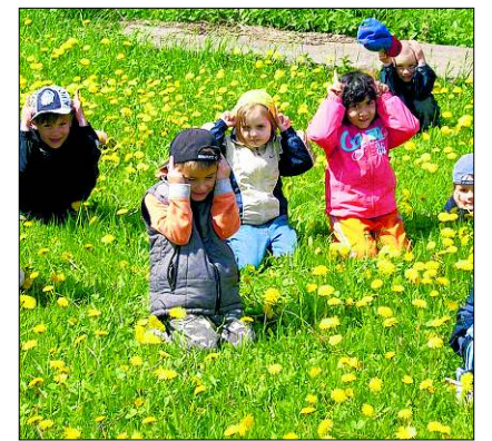
Schon Kindergartenkinder können mit Tandem erste Erfahrungen mit der anderen Kultur jenseits der Grenze sammeln.

Internet: www.tandem-info.net und www.ahoj.info (deutsch-tschechisches Jugendportal)