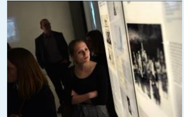
Besuch des NS-Dokumentationszentrums München im Rahmen des Fachforums 2018