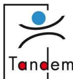
Koordinierungszentrum Deutsch-Tschechischer Jugendaustausch

Eine Initiative des Bundesministeriums für Familie, Senioren, Frauen und Jugend, der Freien und Hansestadt Hamburg, der Robert Bosch Stiftung und des Ost-Ausschusses der Deutschen Wirtschaft