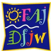
Deutsch-Französisches Jugendwerk Office franco-allemand pour la Jeunesse